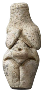
Vénus de Renancourt (-23000 ans)