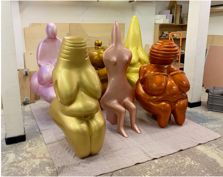
Photos d'atelier. Une vénus sur sons palanquin et les tréteaux utilisés pour le départ de la parade.