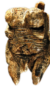
Vénus de Hohle Fels (-35000 ans)

Nous avons choisi ces six vénus pour la singularité et la diversité de leur formes, puis, en modélisation 3D, nous avons synthétisé et modifié leur anatomie afin de leur donner une position assise.