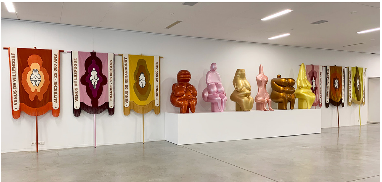
Exposition au M Museum à Louvain (B) - Novembre 2022

Nous avons choisi ces six vénus pour la singularité et la diversité de leur formes, puis, en modélisation 3D, nous avons synthétisé et modifié leur anatomie afin de leur donner une position assise.