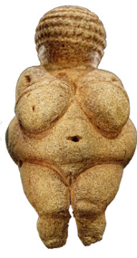
Vénus de Willendorf (- 24000 ans)